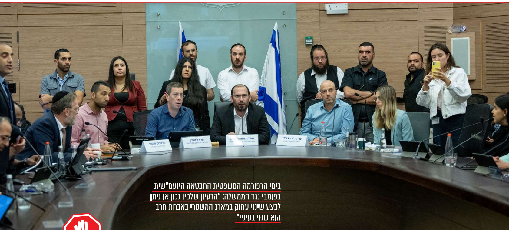
בימי הרפורמה המשפטית התבטאה היועמ"שית בפומבי נגד הממשלה: "הרעיון שלפיו נכון או ניתן לבצע שינוי עמוק במארג המשטרי באבחת חרב הוא שגוי בעיניי"