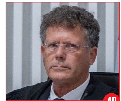
40 התנגדות לדרישה למנות את נשיא בית המשפט העליון בהסכמה רחבה תאריך: 23 ביוני 2024

* הרצון: לאתר סיום תקופת כהונתה של נשיאת בית המשפט העליון אסתר חיות הגישו מועמדות לתפקיד הן השופט יוסף אלרון והן השופט יצחק עמית. שר המשפטים יריב לוין סירב לכנס את הוועדה לדיון בבחירת הנשיא הבא עד שתושג הסכמה רחבה של חברי הוועדה על זהות המועמד, כפי שמחייב החוק בנוגע לבחירת שופטים לבית המשפט העליון.