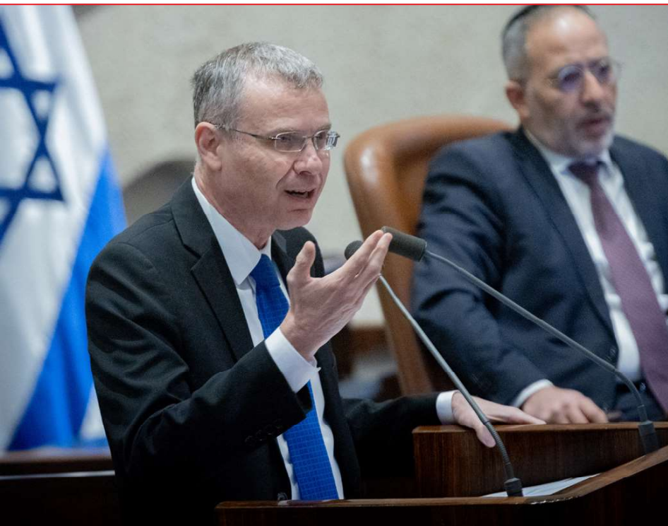
לי. חצה הטכנה וחבה